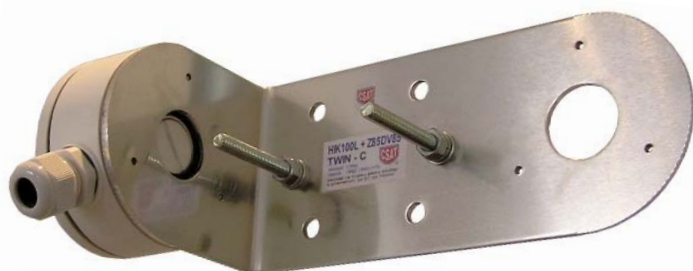
DS-1280ZJ-XS + HIK100L TWIN-C + Z85DV85