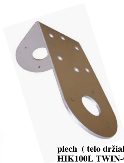
plech ( telo držiaka ) HIK100L TWIN-C