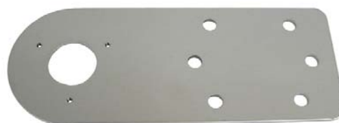
plech ( telo držiaka ) DAH90