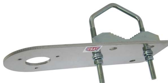
DAH90 + Z85DV85