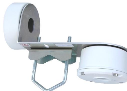
VID100LE + Z75DV75 TWIN-C + TR-JB05-B-IN + TR-JB03-G-IN