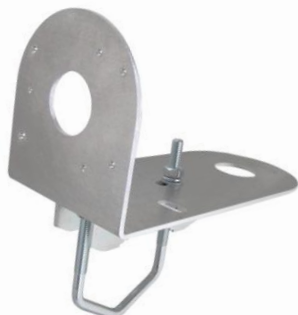
VID100LE + Z75DV75 TWIN-C

profesionálny držiak pre uchytenie dvoch kamier Videosec alebo Uniview prípadne iných značiek na trubku alebo stožiar vo vertikálnej alebo horizontálnej polohe