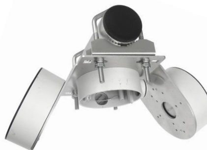
HIK134E TRIO + 2x Z75DV75 montáž na trubku (Ø 60mm)