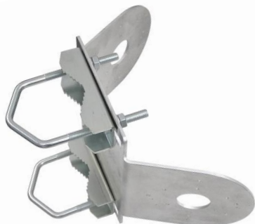
HIK134E TRIO + 2x Z75DV75

profesionálny držiak pre uchytenie troch kamier HIKVISION, DAHUA, TVT a iných značiek na trubku alebo stožiar vo vertikálnej polohe