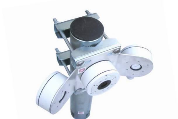
HIK100E TRIO + 2x 2Z5M + 3x DS-1280ZJ-XS

profesionálny držiak pre uchytenie troch kamier HIKVISION, DAHUA, TVT a iných značiek na trubku alebo stožiar vo vertikálnej polohe