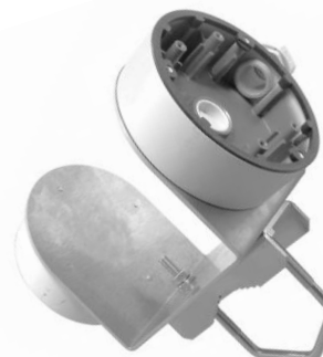
HIK120LE + Z25DV75 TWIN + DS-1280ZJ-DM46 +DS-1260ZJ