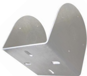
plech (telo držiaka) HIK120LE TWIN