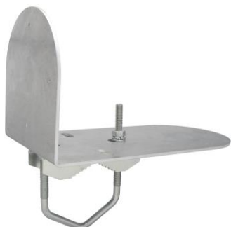
HIK120LE + Z25DV75 TWIN-C

profesionálny držiak pre uchytenie dvoch kamier HIKVISION, DAHUA, TVT a iných značiek na trubku alebo stožiar vo vertikálnej alebo horizontálnej polohe