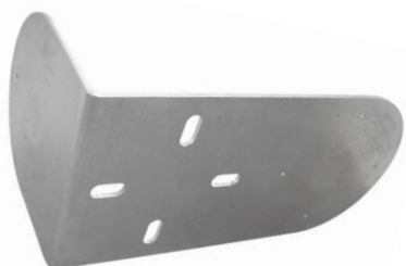
plech (telo držiaka) HIK120LE TWIN-C