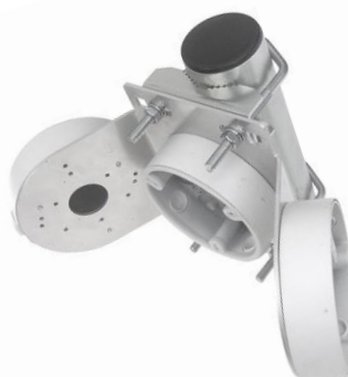
DAH134E TRIO + 2x Z75DV75 montáž na trubku (Ø 60mm)