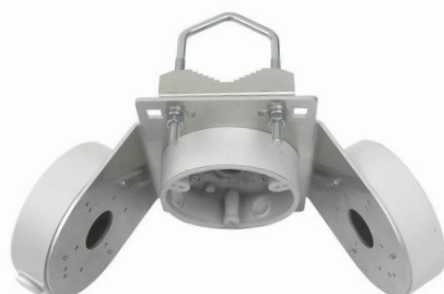
DAH134E TRIO + 2x Z75DV75 + 2x DH-PFA137 + DH-PFA136