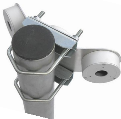
DAH100E TRIO + 2x Z5V105 + 2x DH-PFA134 + DH-PFA135