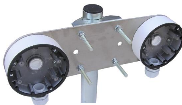
HIK134 + 2x Z85DV85 TWIN + 2x DS-1280ZJ-DM46