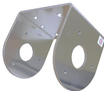
plech ( telo držiaka ) DAH90L TWIN