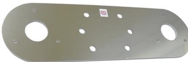
plech ( telo držiaka ) DAH90 TWIN