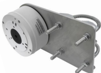
DKH12 + 2x UA70 + TD-YXH0103