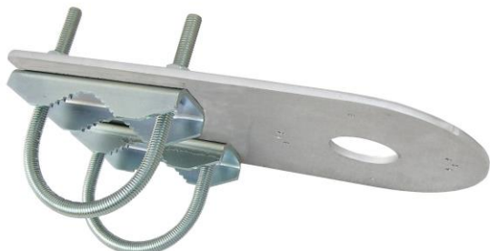
DKH12 + 2x UA70

profesionálny držiak pre uchytenie kamier HIKVISION, DAHUA, TVT a iných značiek na trubku alebo stožiar vo vertikálnej alebo horizontálnej polohe