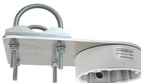
DKH12 + 2x UA70 + TDYXH0101B